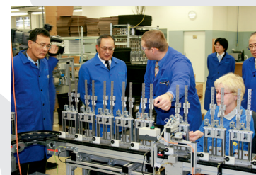
2007: Slavnostní zahájení výroby LWMGG

Akvizice výroby LWMGG od společnosti Hirschmann - Automotive