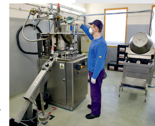
Výroba v bývalém NK CZ

Linky GTMS převezeny z firmy LifeSparc Inc., USA a instalovány na novou budovu č. 20