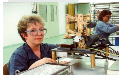
1999: Výroba v Lokaci 1 Jasenice

Vstup japonských investorů do ISS – společný podnik Nippon Kayaku (51%), Nichimen (15%) a ZV Indet (34%)