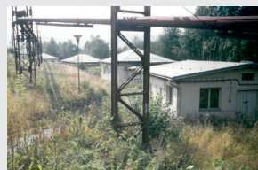
2003: Budovy č. 10, 11, 12 a 38 před rekonstrukcí