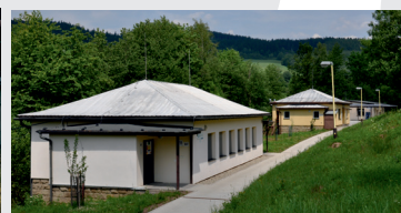
Budovy L3 po rekonstrukci