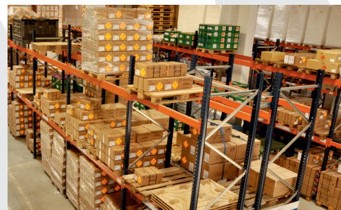
2007: Sklad na Bobrkách

Centrální kanceláře a sklady přestěhovány na Bobrky