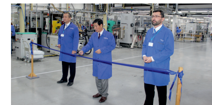
2013: Slavnostní otevření Lokace 4

Operace zástřiku GTMS přemístěna na novou Lokaci 4 na Bobrky