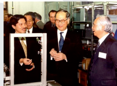
2002: Slavnostní otevření linky MGG