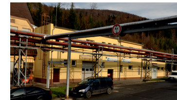
Budova č. 18 a 20

V nové budově č. 18 spuštěna výroba GTMS